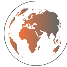
256 x 256px