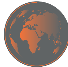
256 x 256px