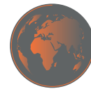
128 x 128px