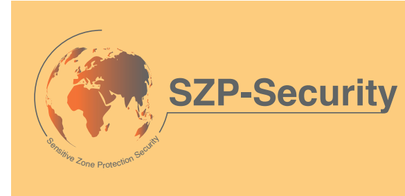
Négatif sur fonds unis et images claires